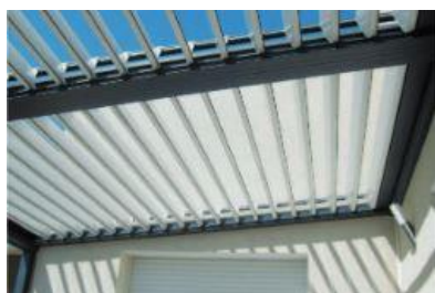
Ouverture des lames