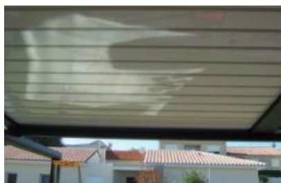
Fermeture des lames