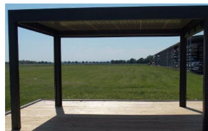
Pose libre sur pieds