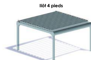
Îlot 4 pieds