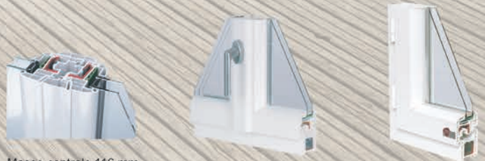
Masse centrale 116 mm

Formes douces et arrondies apportant un design et une esthétique contemporaine à tous les types de construction